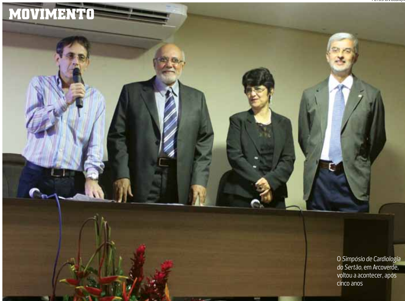
O Simpósio de Cardiologia do Sertão, em Arcoverde, voltou a acontecer, após cinco anos